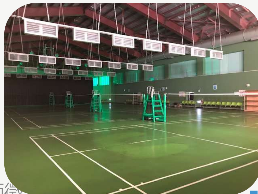
羽球場 排球場 籃球場